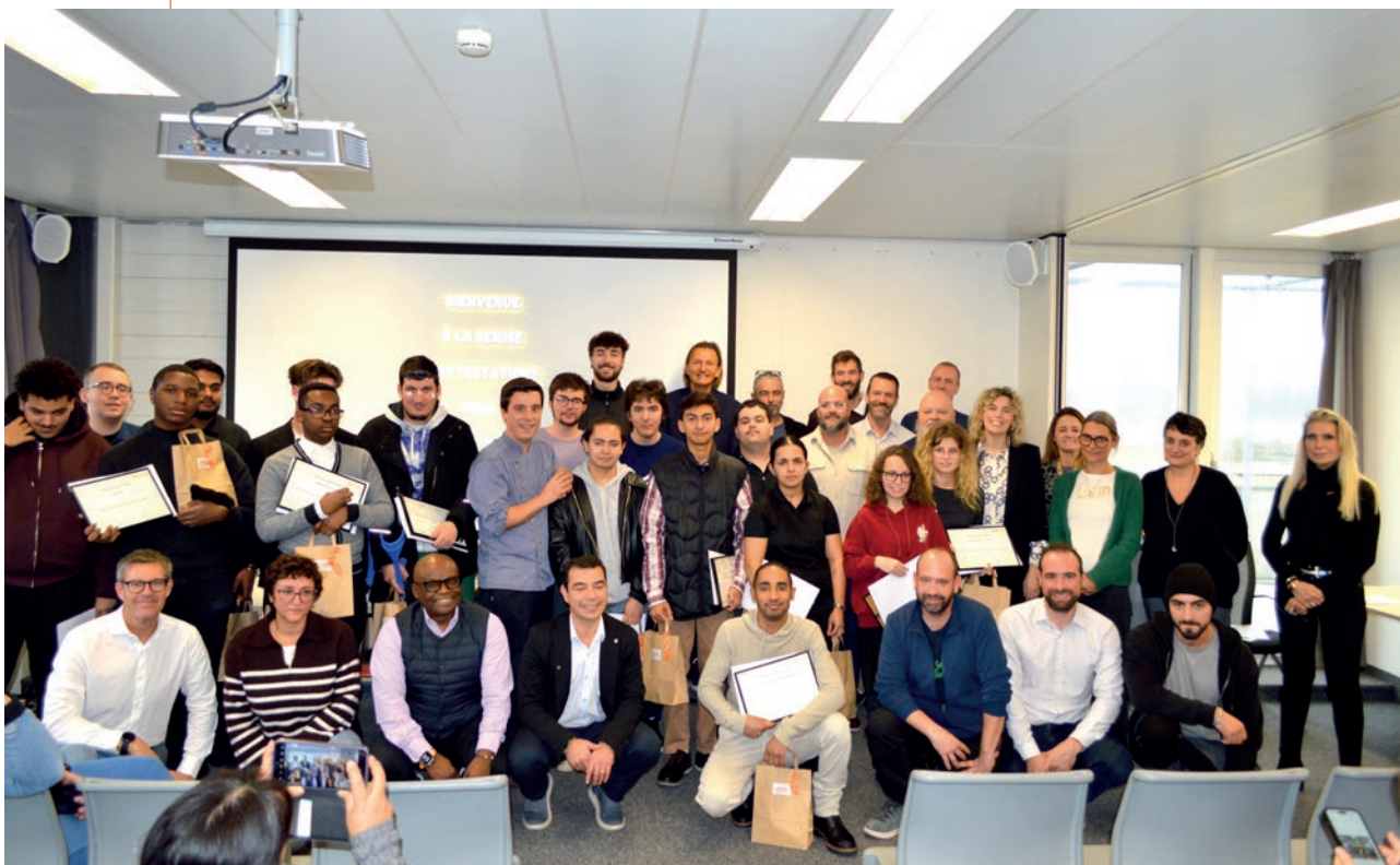
Formation Pratique INSOS