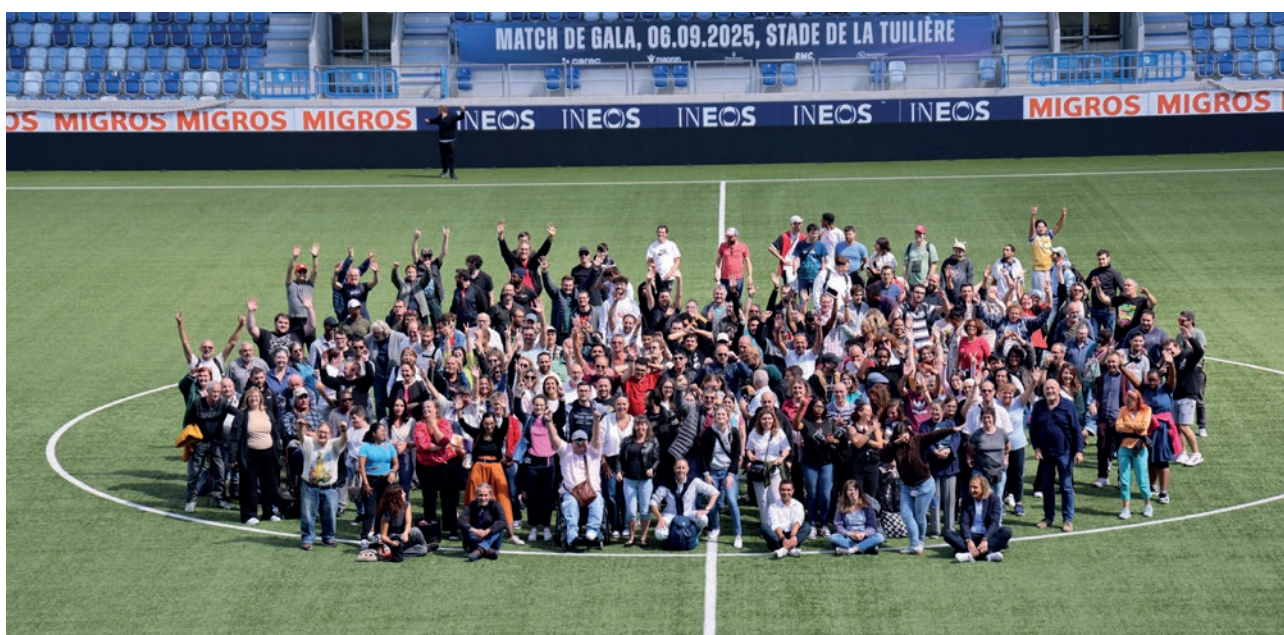
Sortie annuelle des bénéficiaires, Stade de la Tuilière, 4 et 5 septembre 2025